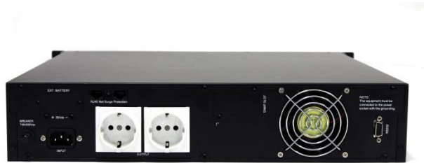
HP910C RM 후면