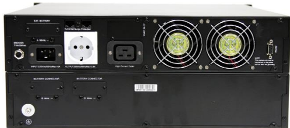
HP920/930C RM 후면